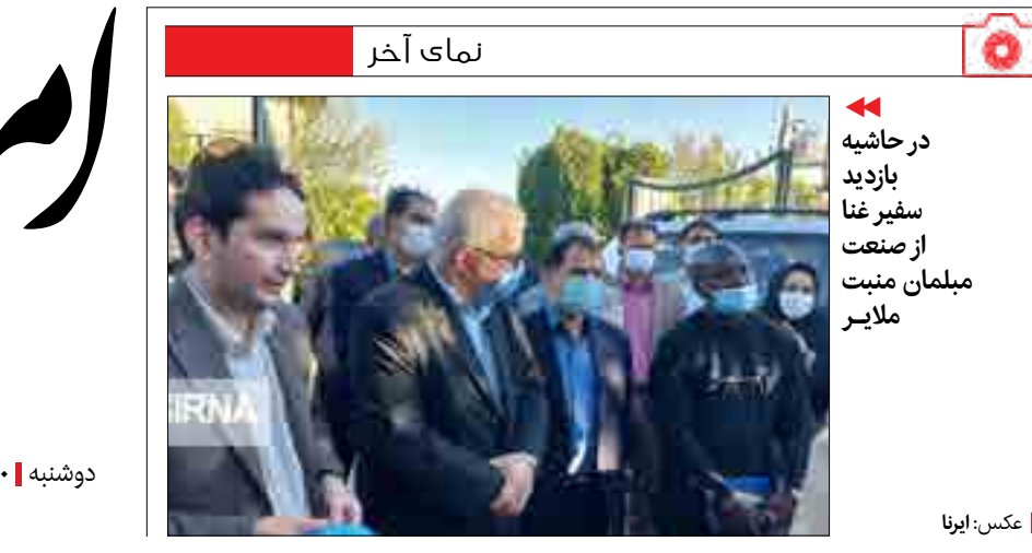
مبلمان منبت از صنعت بازدید در حاشیه ملایر